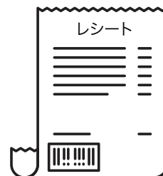
購入時のレシート (購入時使用のポイントカード)