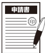
BIC WiMAX初期契約解除申請書 (店頭で記入 or WEBサイトよりダウンロードできます)