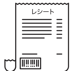
購入時のレシート (購入時使用のポイントカード)